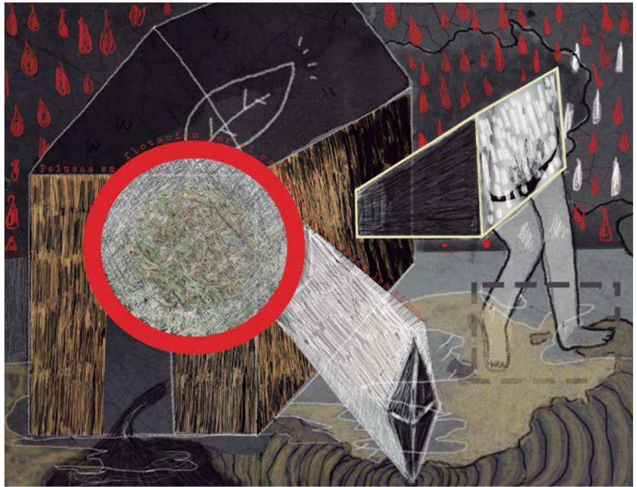
“Pelusas en flotación por el callejón donde arden los tilos.” 40 x 50 cm, collage digital sobre papel algodón, 2018.