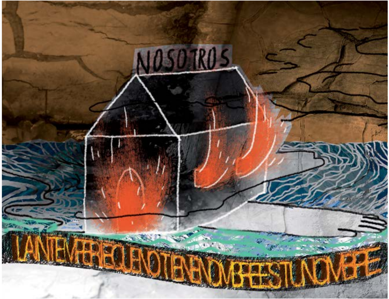
“La intemperie que no tiene nombre es tu nombre.” 40 x 50 cm, collage digital sobre papel algodón, 2018.