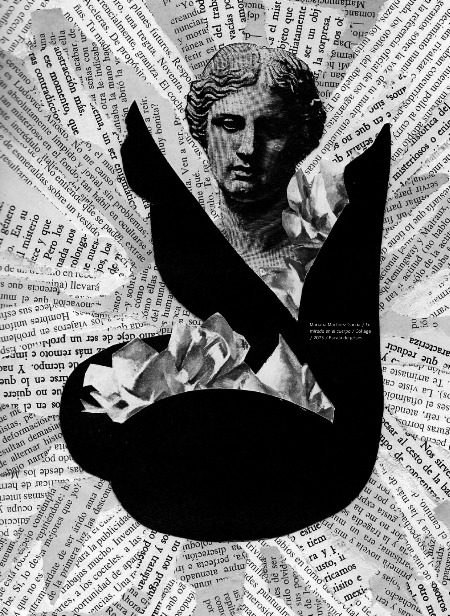
Mariana Martínez García / La mirada en el cuerpo / Collage / 2023 / Escala de grises