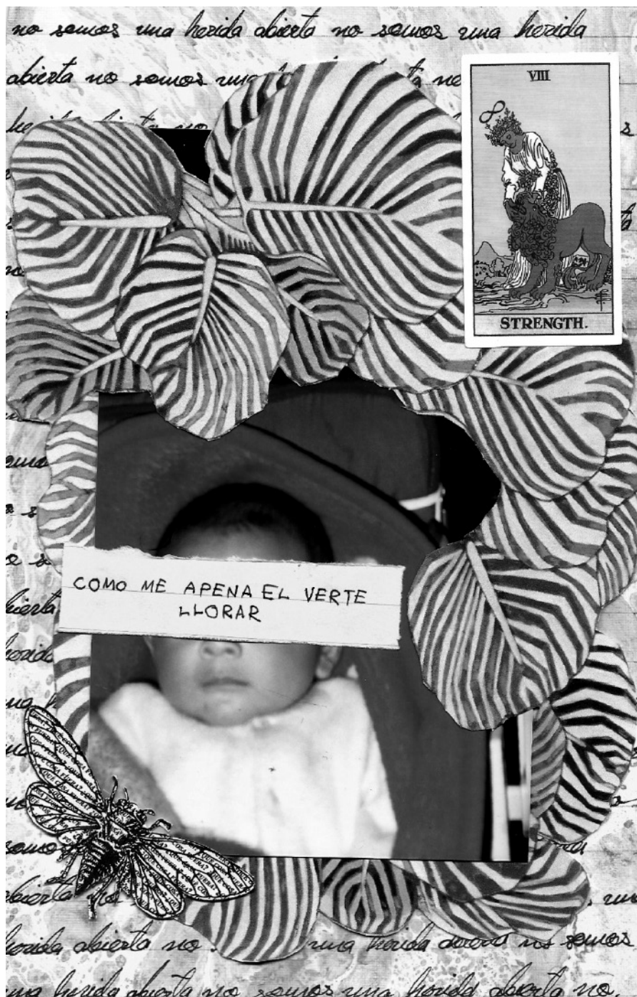
Hermanito por Ángel Hernández Candelaria / Serie: Tríptico familiar / Collage / 2023 / Escala de grises