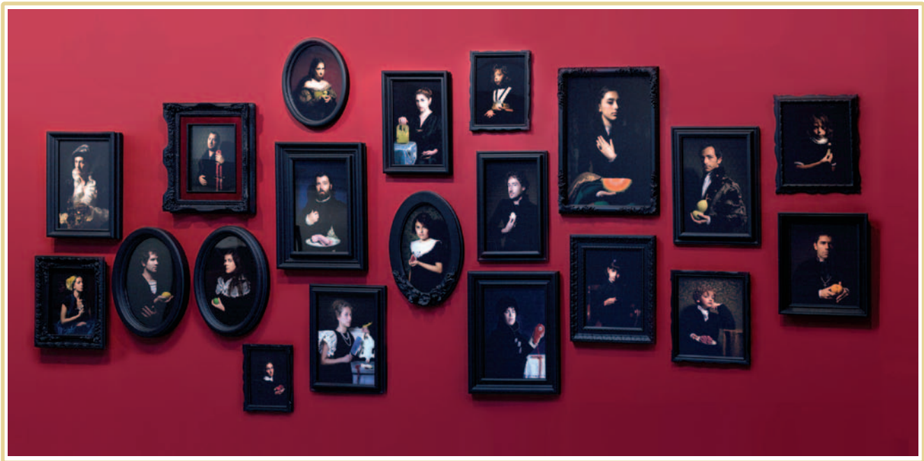
PARASITES AND PERISHABLES / PARÁSITOS Y PERECEDEROS / SERIE DE 20 RETRATOS 2011 / FOTOGRAFÍA DIGITAL

“En las imágenes que estoy haciendo ahora cada escenario es distinto y lo único que las une es un misterio, y eso está abierto a muchas interpretaciones. Por ejemplo, me intriga que de pronto empezaron a aparecer campos de pájaros muertos. Si te pones a investigar, a cada rato pasa eso; sin embargo, para nosotros eso es un símbolo de que algo está terriblemente mal. Me interesa la sensación de una imagen perturbadora, entonces es