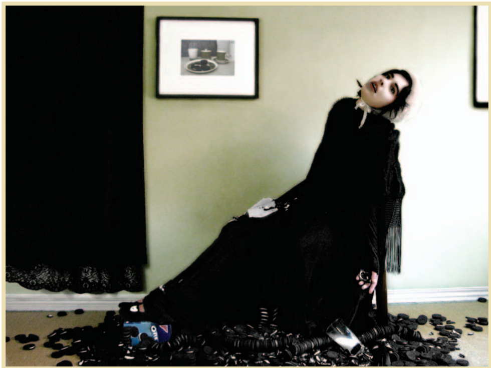
DEATH BY OREOS / MUERTE POR OREOS / DE LA SERIE MUERTE GLAMUROSA (DROP DEAD CORCEUS) / 2006 / FOTOGRAFÍA DIGITAL / 100 X130 CMS.

Su proyecto de tesis para titularse fue Drop dead gorgeus , también llamado Muerte glamurosa . Lo que serían solo cinco fotos para un examen académico terminó siendo un conjunto de imágenes con una técnica asombrosa cuyo hilo conductor es la muerte de mujeres ocasionada por el exceso de alimentos o productos de belleza. Estas imágenes presentan un contraste que llega al absurdo, muy típico en la obra de Edburg, pues siempre muestra dos extremos: uno de